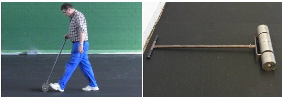
Abrollen des Belages mit einer Anpresswalze

Nach der Verklebung des Belages, allerdings bevor der Kleber komplette ausgehärtet ist, mit einer Walze Anpressdruck ausüben um kleine Bläschen unter der Bahn auszudrücken.