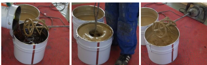
Anrühren des 2-Komponenten PU-Klebers

Der Bodenbelag wird in Rollen geliefert, welche 1-2 Tage bei einer Temperatur von 15°C bis 25°C zur Akklimatisierung dort gelagert werden müssen, wo sie verlegt werden sollen. Am Vortag der Installation den Bodenbelag lose ausrollen damit sich die einzelnen Bahnen entspannen. Vor der Installation sind die beiden Komponenten des Klebers zu mischen. Den gesamten Klebereimerinhalt direkt nach dem Mischen gleichmäßig auf die vorbereitete Installationsfläche gießen (ca. 0,7 kg/m 2 bei SPORTEC 700 2K-PU Kleber ) so dass keine Kleberreste im Eimer zurückbleiben.