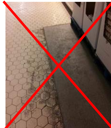
nicht geeigneter Bodenbelag