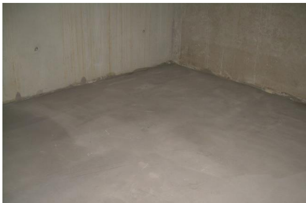
glatter, geeigneter Untergrund aus Betonestrich

Als Untergrund eignen sich asphaltierte und betonierete Flächen sowie ein gegossener Estrichboden. Der Untergrund muss eben, fest, trocken, sauber und frei von Verschmutzungen und Rissen sein, die das Verkleben beeinträchtigen können. Im Außenbericht ist gegebenenfalls ein Gefälle von 0,8% – 1,0% zum Ablauf von Regenwasser an der Belagsoberfläche mit einzuplanen.